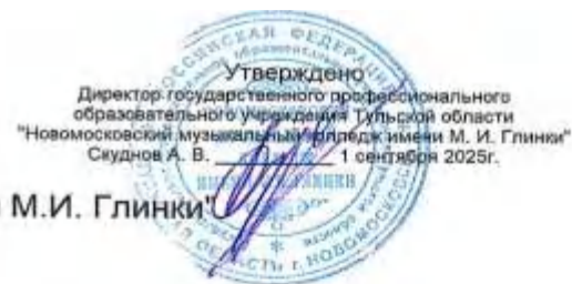
Структура ГПОУ ТО "Новомосковский музыкальный колледж имени М.И. Глинки"

В состав Наблюдательного совета, представляющим государственно-общественное управление Колледжа, входят: представители Учредителя - 1, представитель министерства имущественных и земельных отношений Тульской области - 1, представители общественности, в том числе лица, имеющие заслуги и достижения в соответствующей сфере деятельности - 3 (по согласованию), представители работников колледжа - 2 (по согласованию). Директор и его заместители не могут быть членами Наблюдательного совета Колледжа.